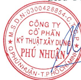
DƯƠNG DŨNG NHÂN